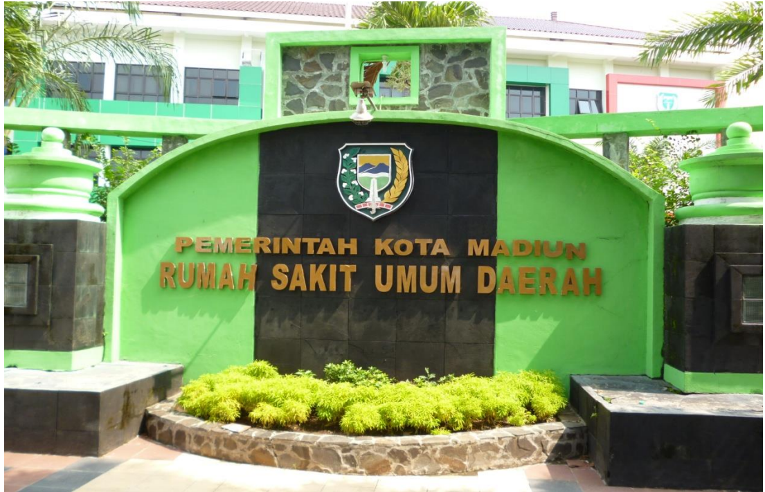
Foto dan alamat RSUD Kota Madiun

Alamat RSUD Kota Jl. Campursari 12 B Madiun